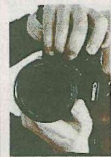
Pronti per scoprire la tecnica fotografica